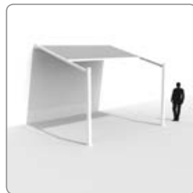
Optie 1 met waterafvoer