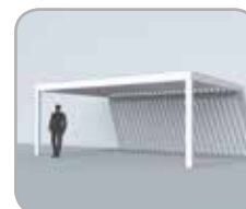
Gevelmontage (2 kolommen)