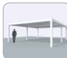
2-delig koppelbaar aan pivot- of spanzijde