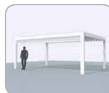
Pivotzijde voorzien van geïntegreerde Fixscreen®

Deze uitbreidingen zijn ook achteraf perfect integreerbaar.