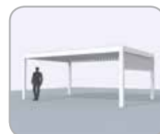
Spanzijde voorzien van geïntegreerde Fixscreen®