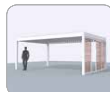
Spanzijde voorzien van Loggiawood® of Loggiascreen® 4FIX