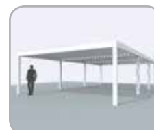
Meerdelig koppelbaar aan pivot- of spanzijde