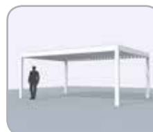
Vrijstaand (4 kolommen)