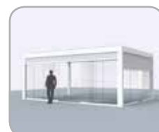
Pivot- en/of spanzijde voorzien van glazen schuifwanden al of niet in combinatie met geïntegreerde Fixscreen®