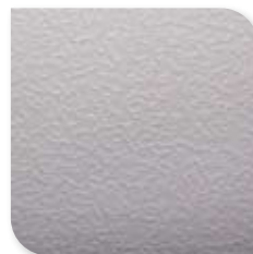
1249 Mat Aluminium TX