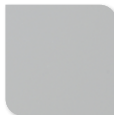
1210 Aluminium Spiegel Naturel