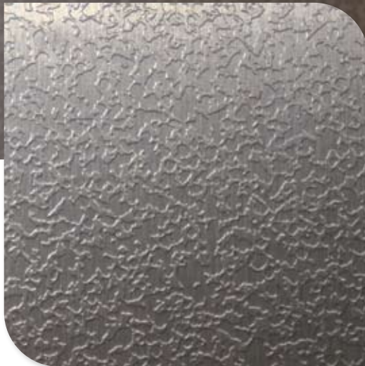
1256 Geborsteld Staal TX