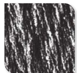
M023 Tin nuance Lei