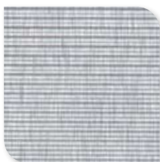
1250 Geborsteld Aluminium DSS