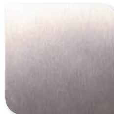
1350 Geborsteld Aluminium (Krasvast)