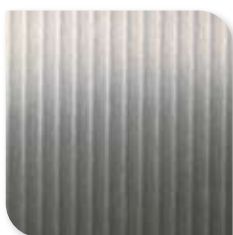
1256 Geborsteld Staal WW