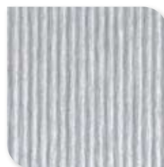
1250 Geborsteld Aluminium LSS