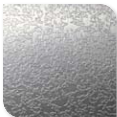
1250 Geborsteld Aluminium TX