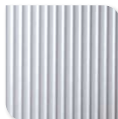
1249 Mat Aluminium WW