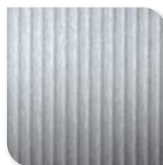
1250 Geborsteld Aluminium WW