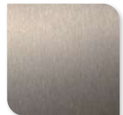
1356 Geborsteld Staal (Krasvast)